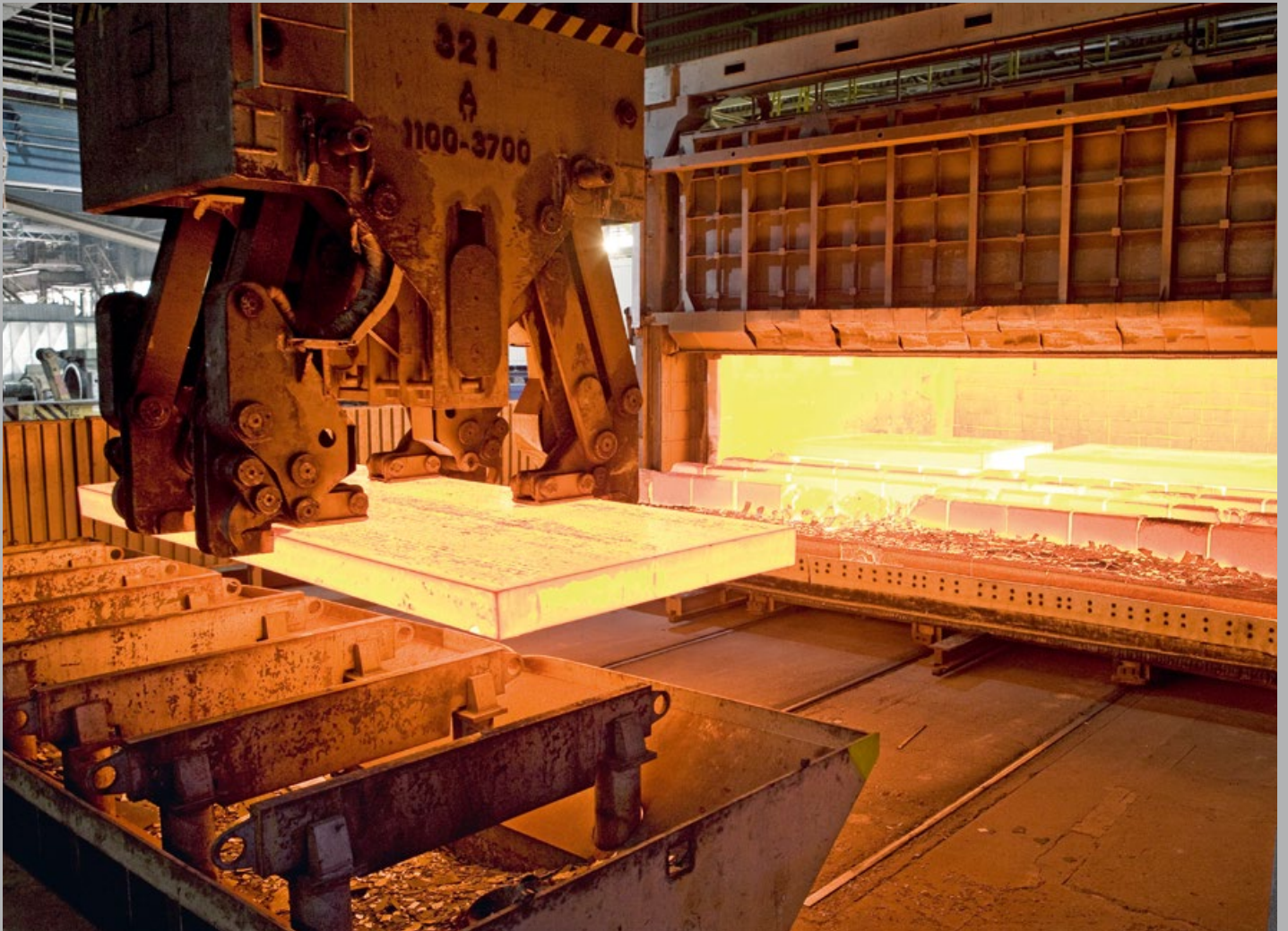
Im Herdwagenofen werden bis zu 32 Tonnen schwere Brammen für den Walzvorgang erwärmt.