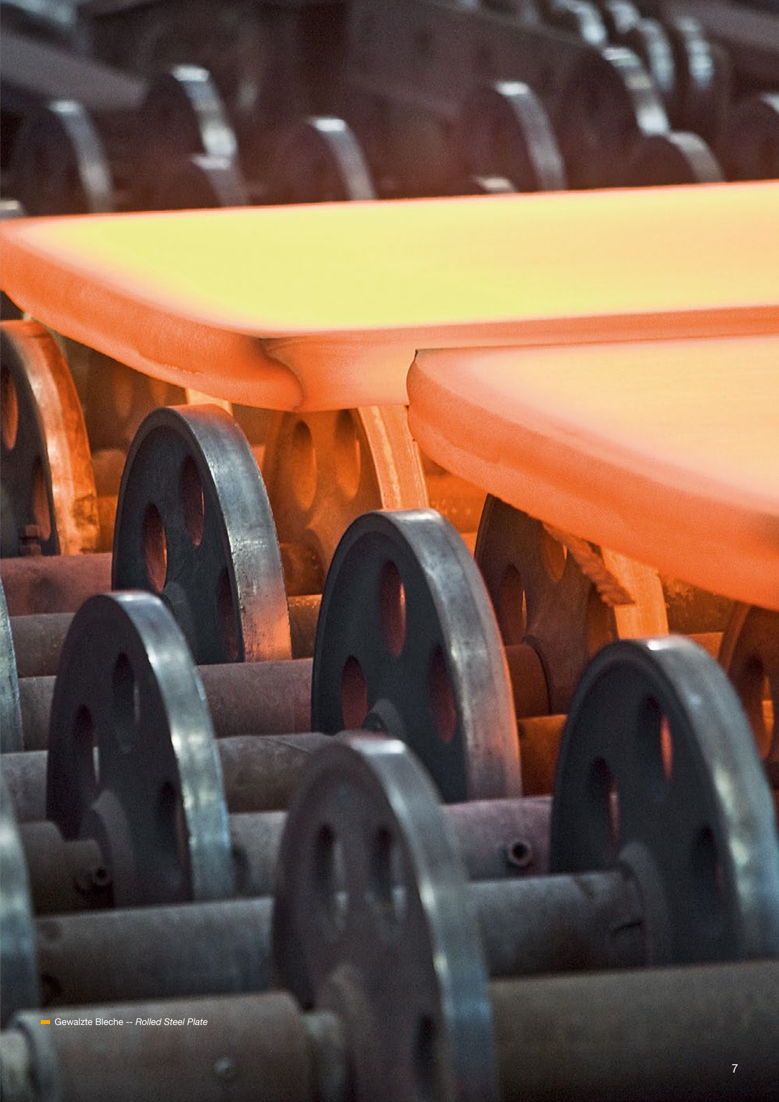
— Gewalzte Bleche -- Rolled Steel Plate