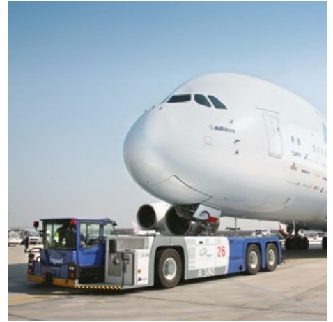
■ Beispiele für den Einsatz unserer hoch- und verschleißfesten Bleche – MAXIL® und BRINAR®: Reachstacker von Liebherr (Bild links), WM-Stadion in Durban, Südafrika (Bild Mitte), Flugzeugschlepper von Goldhofer (Bild rechts). -- Examples of the application of our high-strength and abrasion resistant steels – MAXIL® and BRINAR®: Reachstacker of Liebherr (left picture), World Cup Stadium in Durban, South Africa (center picture), Aircraft Tractor of Goldhofer (right picture).