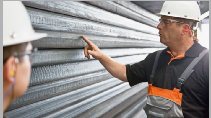
■ Visuelle Qualitätskontrolle der Bleche -- Visual Quality Control of the Plates

Am Standort Ilseburg walzen wir für unsere Kunden monatlich bis zu 17.000 Einzelbleche mit einem maximalen Blechgewicht von 28 Tonnen. Dabei sorgen unser extrem steifes Quartowalzgerüst, das präzise Stichplan-Rechnermodell und die Dickenmessung durch Isotopendurchstrahlung für engste Maßtoleranzen.