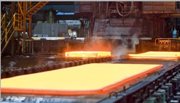
■ Parallelrollgang -- Side Shift Table

FÜR UNSERE KUNDEN FERTIGEN WIR GROBBLECHE, DIE GENAU IHREN INDIVIDUELLEN QUALITÄTSANFORDERUNGEN ENTSPRECHEN. DIE BASIS DAFÜR BILDEN UNSERE MODERNEN FERTIGUNGSANLAGEN, DIE WIR DURCH REGELMÄSSIGE INVESTITIONEN IMMER AUF DEM NEUESTEN STAND DER TECHNIK HALTEN. -- FOR OUR CUSTOMERS WE PRODUCE QUARTO PLATES THAT ARE PERFECTLY ADAPTED TO THEIR INDIVIDUAL QUALITY REQUIREMENTS. OUR HIGH QUALITY STANDARD IS BASED ON OUR MODERN PRODUCTION FACILITIES, WHICH ARE MAINTAINED AT STATE OF THE ART BY REGULAR INVESTMENTS.